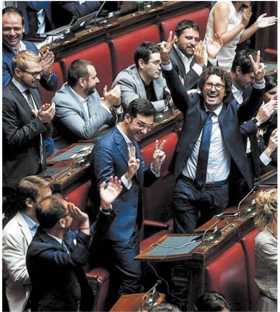
I Cinquestelle | deputati del Movimento festeggiano il risultato della votazione alla Camera